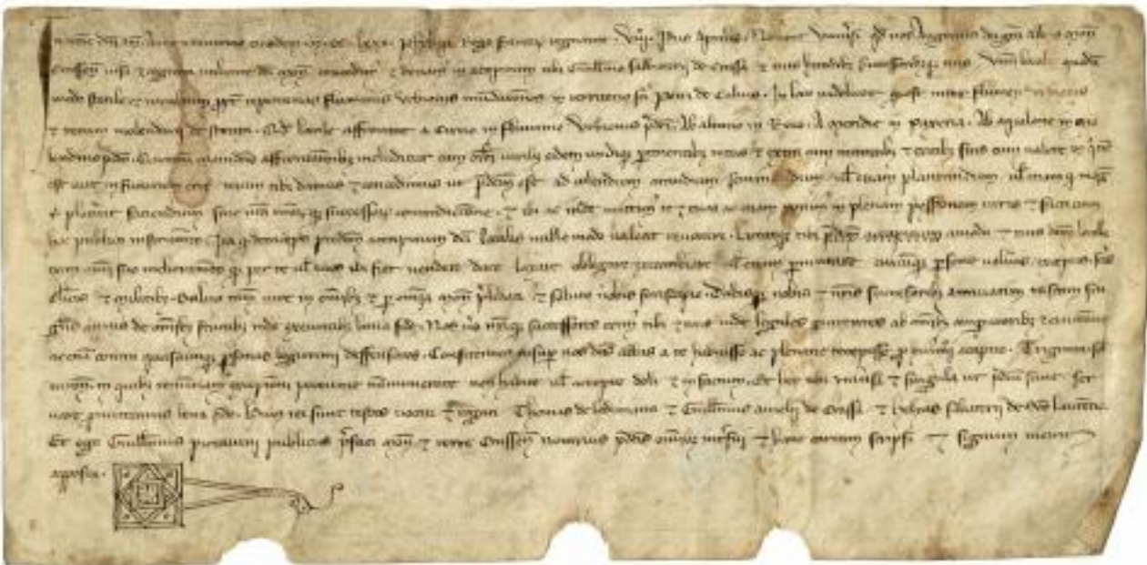
Seing manuel de Guillaume Pictavini, notaire public de Lagrasse, 1280 (Arch. dép. Aude, H80)

Chaque exercice comprend une brève analyse des actes et quelques informations historiques ; une transcription du document (les lignes sont numérotées ; dans le cas d'abréviations, les lettres restituées sont indiquées en italique ; l'orthographe est respectée mais l'accentuation est celle d'aujourd'hui ; pour une meilleure compréhension, la ponctuation est restituée suivant les principes actuels) ; éventuellement une traduction dans le cas d'un document en latin ou en occitan.