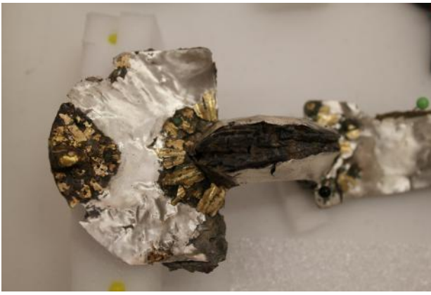
Détail d'une fibule recouverte d'une tôle d'argent et de paillons d'or

De nombreux éléments de parure, ainsi que des bijoux et des armes ont été mis au jour dans les sépultures wisigothiques par les archéologues. Le plus souvent, ces éléments ont été retrouvés en place utilitaire ce qui permet d'affirmer que la population enterrée à Pezens pratiquait l'inhumation habillée, coutume qui n'était pas pratiquée dans l'Antiquité romaine.