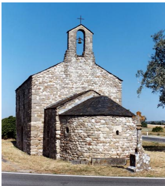
La chapelle de la Madeleine

Le caractère particulièrement dangereux du carrefour de la Madeleine a conduit la Direction des Routes du Département de l'Aude à en repenser l'aménagement pour créer un giratoire. Comme lors de tous les travaux d'aménagement du territoire, les services de l'Etat ont dû au préalable statuer sur l'intérêt archéologique de la zone concernée. La présence de la chapelle de la Madeleine, petit édifice roman classé Monument historique, et des découvertes anciennes laissaient en effet penser que le terrain pouvait livrer d'intéressants vestiges.