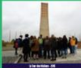
Le Monument - 04

Le temps fort de ce 18 e Voyage au nom de la Mémoire fut la découverte du camp de concentration de Sachsenhausen, un lieu qui a profondément marqué élèves comme accompagnants.