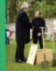
Le 3 février 2016 - 08