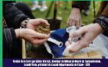
Le 3 février 2016, un peu de terre du camp est déposée au pied du Monument de la Résistance - 06