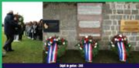
Le 3 février 2016 - 07