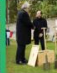
Le 3 février 2016 - 08