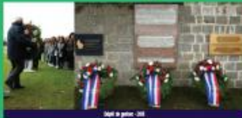
Le 3 février 2016 - 07