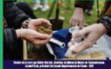
Le 3 février 2016, un peu de terre du camp est déposée au pied du Monument de la Résistance - 06